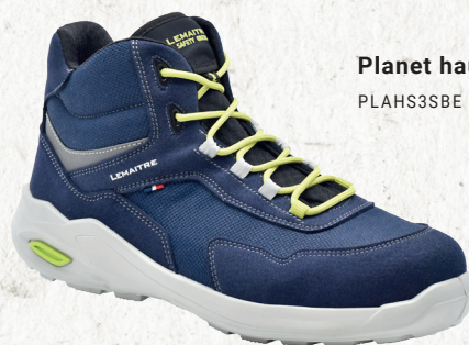
Planet haut bleu S3S PLAHS3SBE