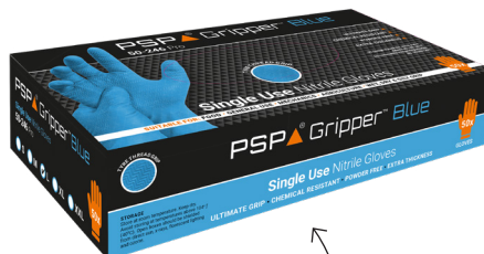
Per 50 stuks verpakt in aantrekkelijke dispenserbox