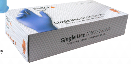
Per 100 stuks verpakt in aantrekkelijke dispenserbox